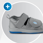
Relief Dual® Fußteilent- lastungsschuh