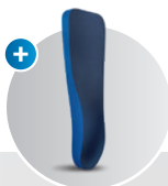
Relief Contour Insole Weichbettungs- einlegesohle