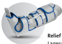
Relief Insert® Lagerungs- schiene

Der neue modulare Walker von DARCO, ein Novum auf dem Hilfsmittelmarkt: Zum einen eine Lagerungsschiene zur Spitzfußprophylaxe und zum anderen eine auf- und abrüstbare Walker-Alternative.